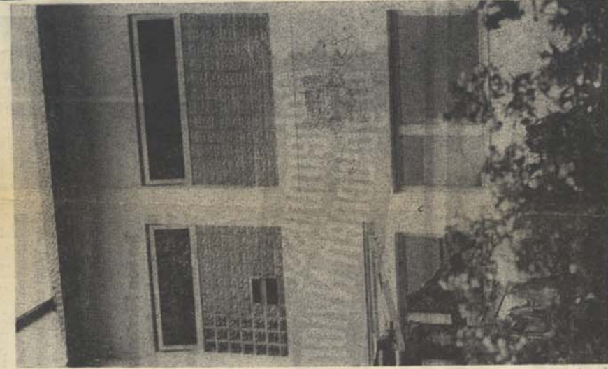
SCHWERIGE GELÄNDEVERHÄLTNISSE MACHTE SICH DIE METZGEREI DÜRR IN NÖTTINGEN BEI DER ERSTELLUNG IHRES NEUBAUS NUTZBAR. UNSER BILD ZEIGT EINEN TEIL DES GEBÄUDES VON DER HAUPTSTRAßE AUS, DESSEN DREI STOCKWERKE DURCH EINEN LASTENAUFZUG VERBUNDEN SIND. DIE ANLIEFERUNG DES SCHLACHTVIEHS ERFOLGT VON RÜCKWÄRTS ÜBER DEN BERG.

Mit den Bauarbeiten begonnen wurde Mitte Januar 1967. Trotz umfangreicher Erdbewegungen, die al-